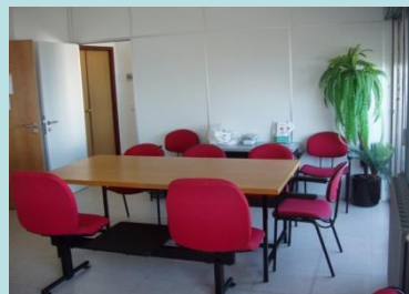
Sala de reuniones Y de actividades

Con tu ayuda, podremos avanzar en nuestros Intereses.