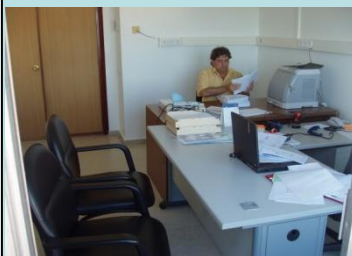
Oficina de Administración