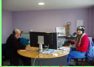
Miembros de la Directiva En un programa de Radio

Los miembros de esta Asociación, además de la atención a los enfermos y trasplantados, realizamos una serie de actividades para el fomento de la donación de órganos, intentando mentalizar a la sociedad de la gran importancia que ello supone, como lo demuestra nuestro mismo ejemplo. Estas actividades las llevamos a cabo por medio de charlas, medios de comunicación (TV, Radio, Prensa), distribución de folletos, etc. Estos son algunos de los ejemplos: