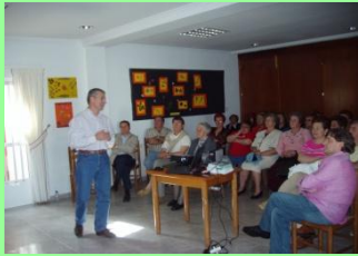
Charlas de concienciación para el fomento De la donación de órganos